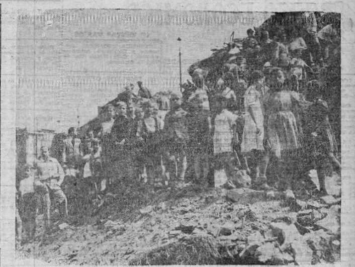
ACCIDENTE AEREO EN BERLIN — Niños alemanes mantienen un horror silencioso mientras observan que las brigadas de salvamento limpian los escombros de un avión C-47 norteamericano que se estrelló sobre un edificio de apartamentos cuando llevaba víveres a Berlín.