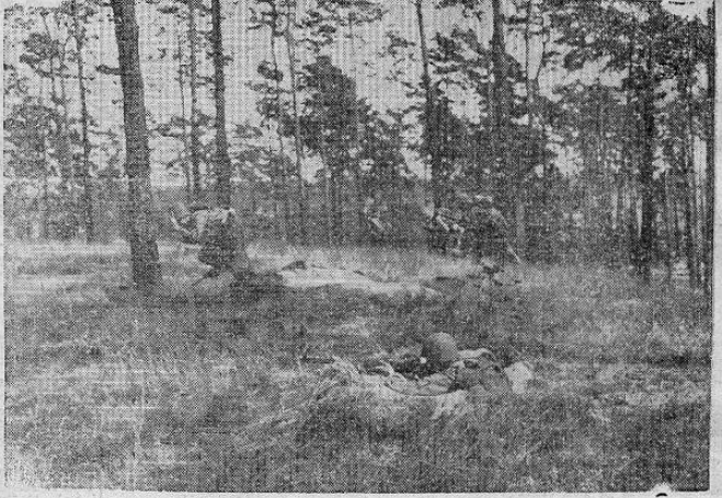
LISTOS EN BERLIN — Tropas del escuadrón 16 de Consabularios norteamericanos avanzan bajo condiciones de combate simuladas duran'e unas extensas maniobras en el bosque le Grunewald, cerca del sector soviético de Berlín. Los Estados Unidos han dicho claramente que tienen intenciones de permanecer en la capital alemana.

Quite sus dolores con SAS , el analgésico perfecto.