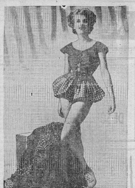
TRAJE PARA LA PLAYA — De la casa de Jacques Heim de París ha salido una nueva colección de trajes para la playa. Entre ellos se encuentra este que luce admirablemente esta francesa.

DE PASTEUR ... No os dejéis corromper por un escepticismo estéril y deprimente. No nos desalentéis ante la tristeza de ciertas horas que pasan sobre las naciones. Vivid en la serena paz de los laboratorios y de las bibliotecas. Preguntas primero: "¿Qué he hecho por instruirme?" Y después, a medida que veáis progresando: "¿Qué he hecho por mi patria?" Hasta que llegue el día en que podáis tener la inmensa satisfacción de pensar que habéis contribuido de alguna manera al progreso y al bienestar de la humanidad. Lo que hace penosa una obra de legislación no es tanto lo que se ha de hacer como lo que se ha de destruir.